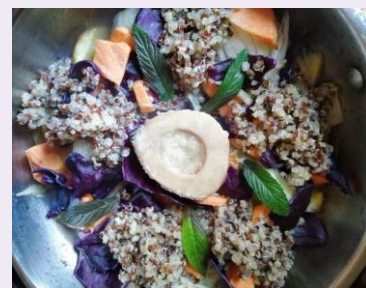
Os à moelle, légumes et quinoa Claudine T - Paris 17e

A l'aide de 5 ingrédients de base que tout un chacun pouvait avoir à portée de mains dans ses placards, les participants devaient partager des recettes de saison bonnes pour la santé, goûteuses, atout Bien-être et convivialité. Une opération originale qui a remporté, pendant cette période de confinement, un franc succès.